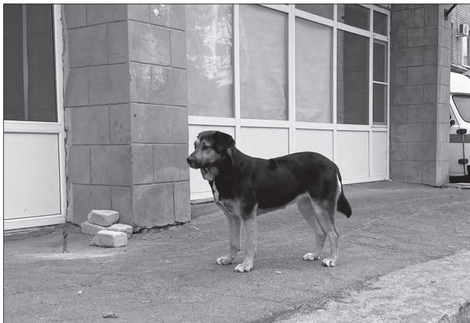
■ Возле больницы часто можно увидеть бездомного пса с биркой на ухе, который надеется обрести хозяина

Актуальная современная проблема вызывает беспокойство у равнодушных жителей города и сел района