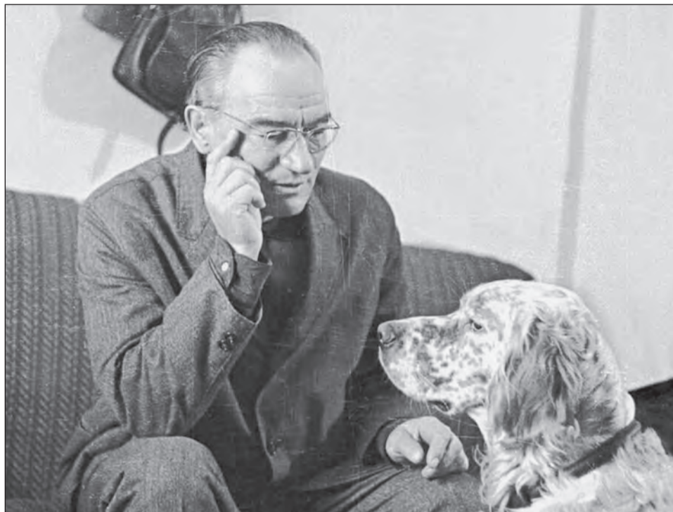
■ Гавриил Троепольский с псом Лель

В 1959 году Троепольский с семьей поселился в Воронеже на улице Чайковского. Главный библиотекарь модельной библиотеки №32 имени Г.Н. Троепольского Лилия Копаева рассказала, что во дворе дома №8, где жил Гавриил Николаевич, росло много фруктовых деревьев. Жильцы в 1961 году составили план благоустройства двора и посадили там 70 яблонь и груш, более 150 декоративных деревьев. Гавриил Николаевич посадил несколько лиственных, хвойных деревьев, две яблони сорта «коричная», груши и сливы. До наших дней сохранились четыре яблони и груша. Они продолжают плодоносить. Сотрудники модельной