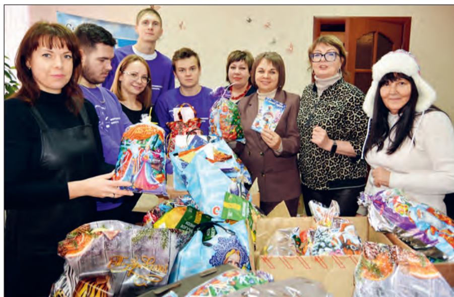
Коллектив колледжа и сотрудники редакции готовят подарки к отправке в зону СВО

Дорогой боец! Береги себя и верь, что у тебя есть надежная поддержка в тылу, где в тебя безоговорочно верят. Пусть наши новогодние подарки станут теплой весточкой из родного дома и напоминанием о детской надежде на то, что новогодние чудеса всегда исполняются.