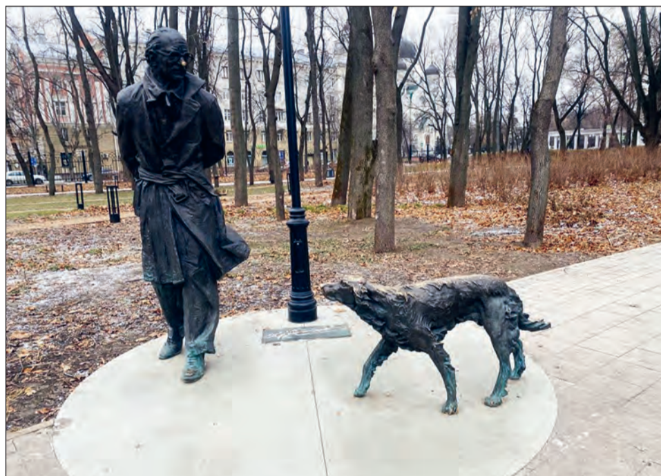
■ Памятник Троепольскому в Воронежском парке «Орленок»

библиотеки №32 бережно ухаживают за ними. По словам Лилии Копаевой, это настоящая живая зеленая история нашего города. На фасаде дома №8 на улице Чайковского в 1998 году разместили мемориальную доску из розового карельского гранита, посвященную Гавриилу Троепольскому.