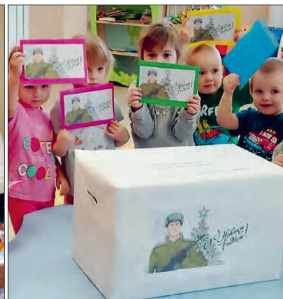
Малыши рады поучаствовать в важном деле