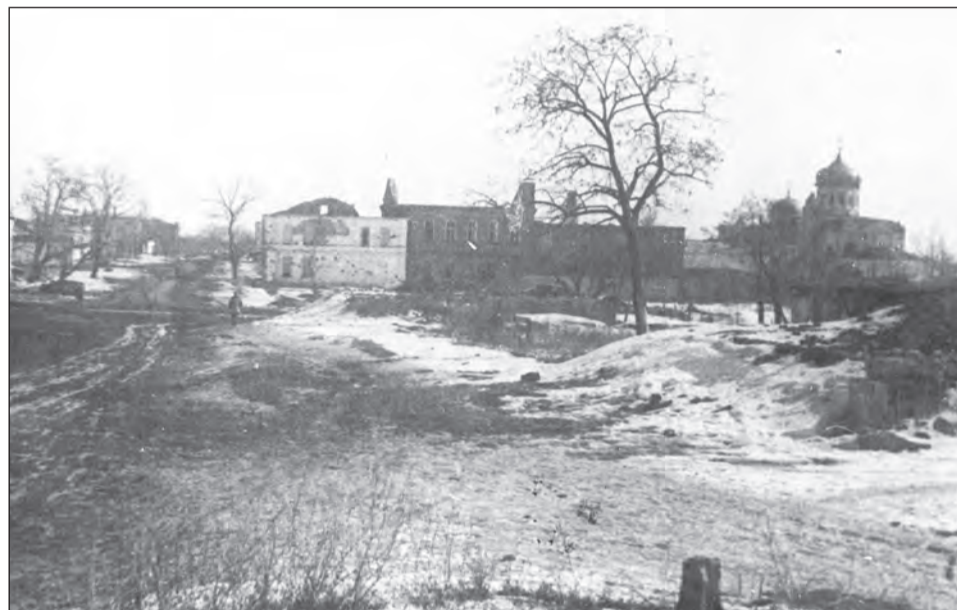
■ Улица Карла Маркса в Богучаре. Декабрь 1942 года

82 года назад с территории района были изгнаны немецкие захватчики