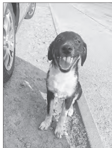
■ Брошенным животным постоянно грозит опасность

Также существует статья 245 УК РФ — жестокое обращение с животными, в целях причинения ему боли и страданий. Предусмотрено наказание штрафом в размере до 80 тысяч рублей или в размере заработной платы за период до шести месяцев, исправительными работами на срок до одного года, или же ограничением свободы на срок до одного года.