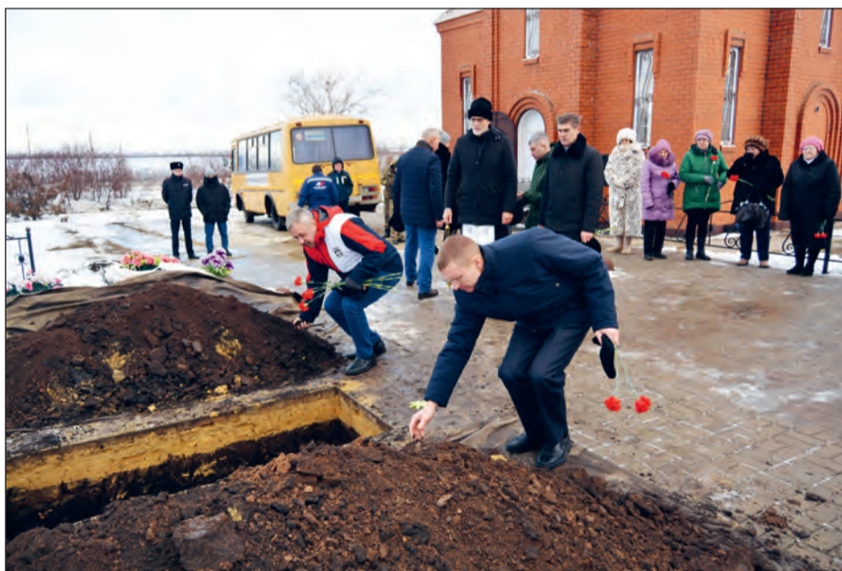
■ По православному обычаю останки погибших красноармейцев были преданы земле

На траурном митинге присутствовали официальные лица, представитель духовенства, представители региональной