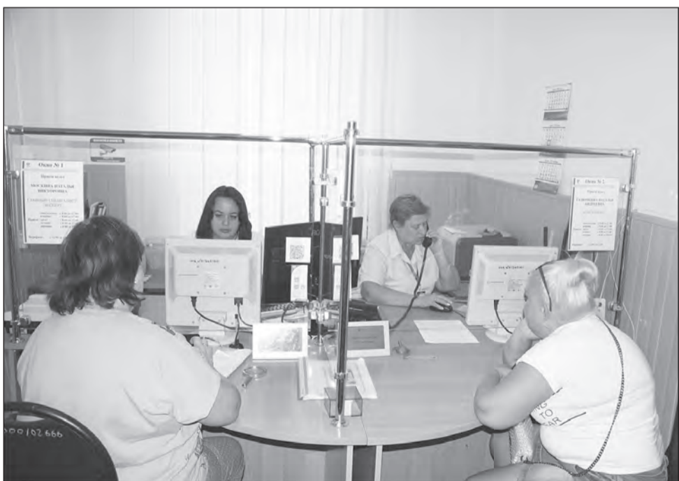
■ Прием ведут специалисты клиентской службы

В сформированной электронной выписке информация о льготном стаже будет