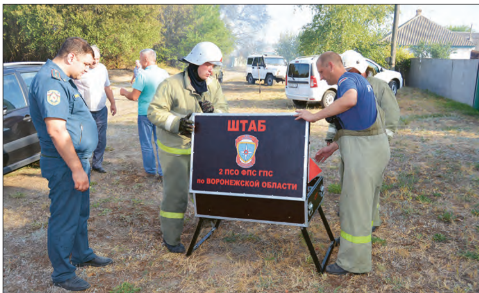
В Журавке был развернут штаб по координации действий при ЧС