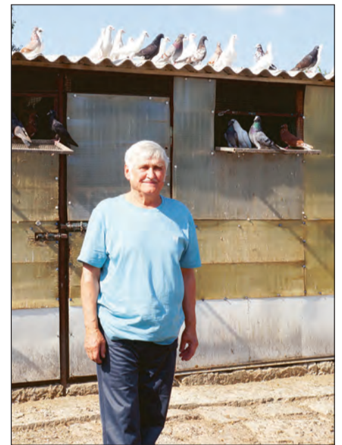
■ Голуби дружно реагируют на звуковой сигнал

К слову, Моисеев ежегодно на корм голубям заготавливает 6-7 тонн зерна, в основном это пшеница, овес, маслосемена. Также необходимо постоянно применять минеральные корма и лекарственные препараты. Все это требует определенных финансовых затрат, однако голубе-