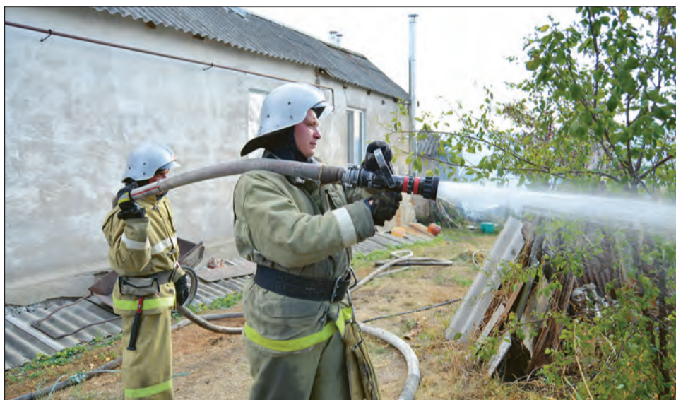
Спасатели мужественно противостояли огню

Пожарные боролись с огнем в течение восьми часов