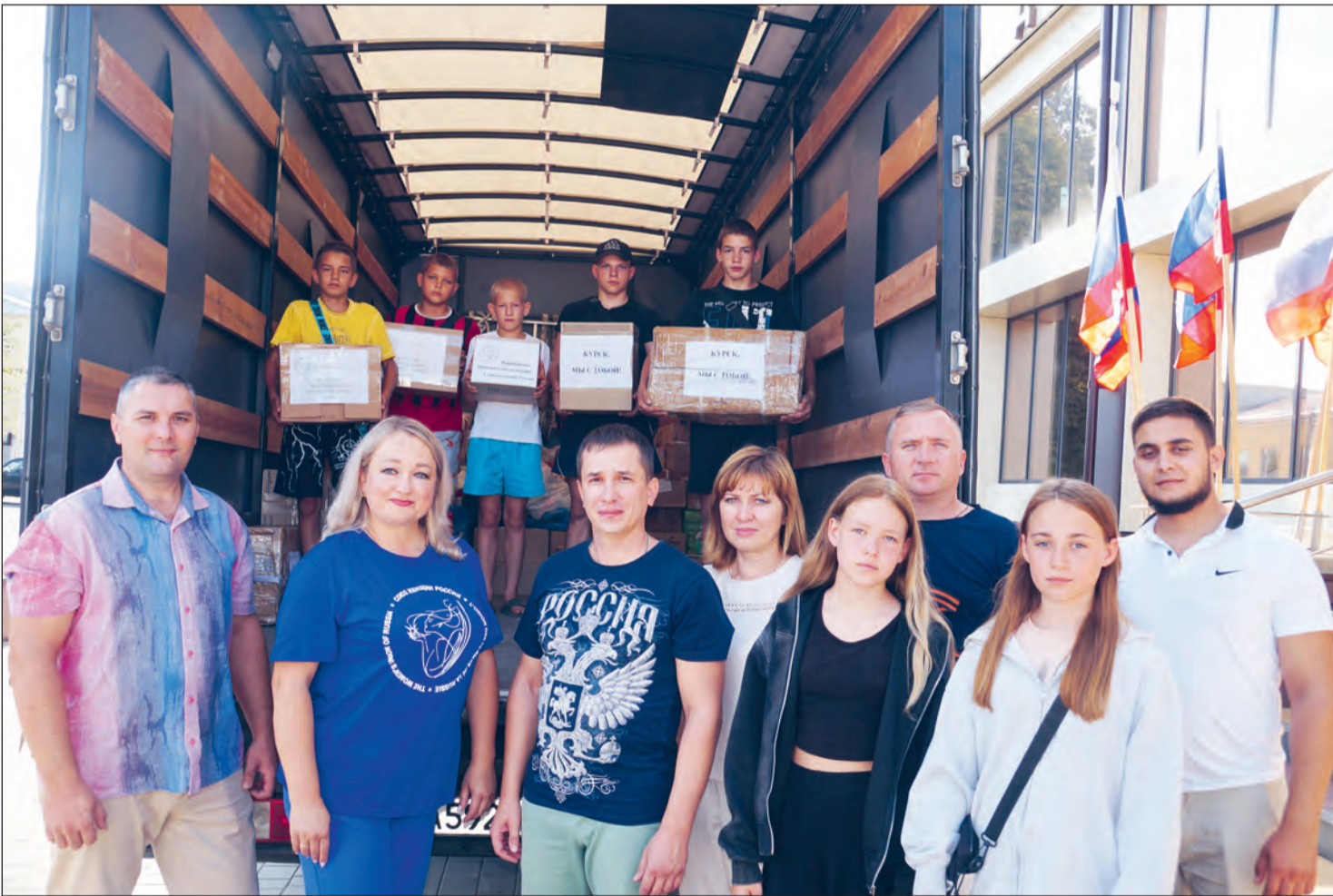
Гуманитарный груз готов к отправке в Курскую область

В районе прошел сбор средств и гуманитарной помощи для жителей Курской области