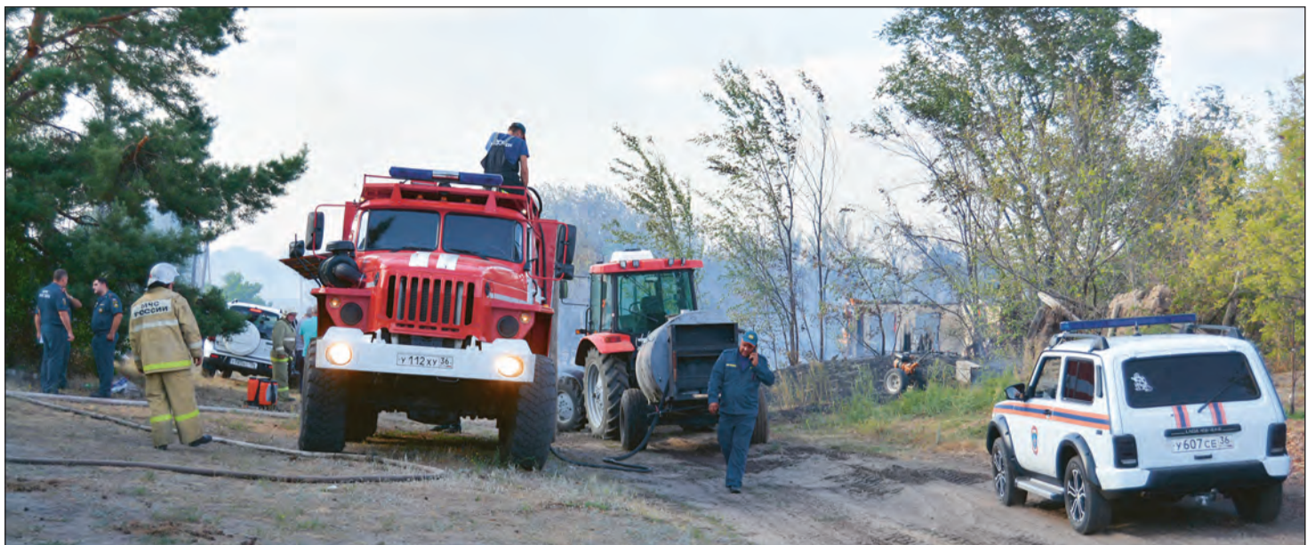
Во время тушения пожара все службы действовали слаженно

Представители районной администрации находились на месте происшествия и оперативно решали все текущие вопросы.