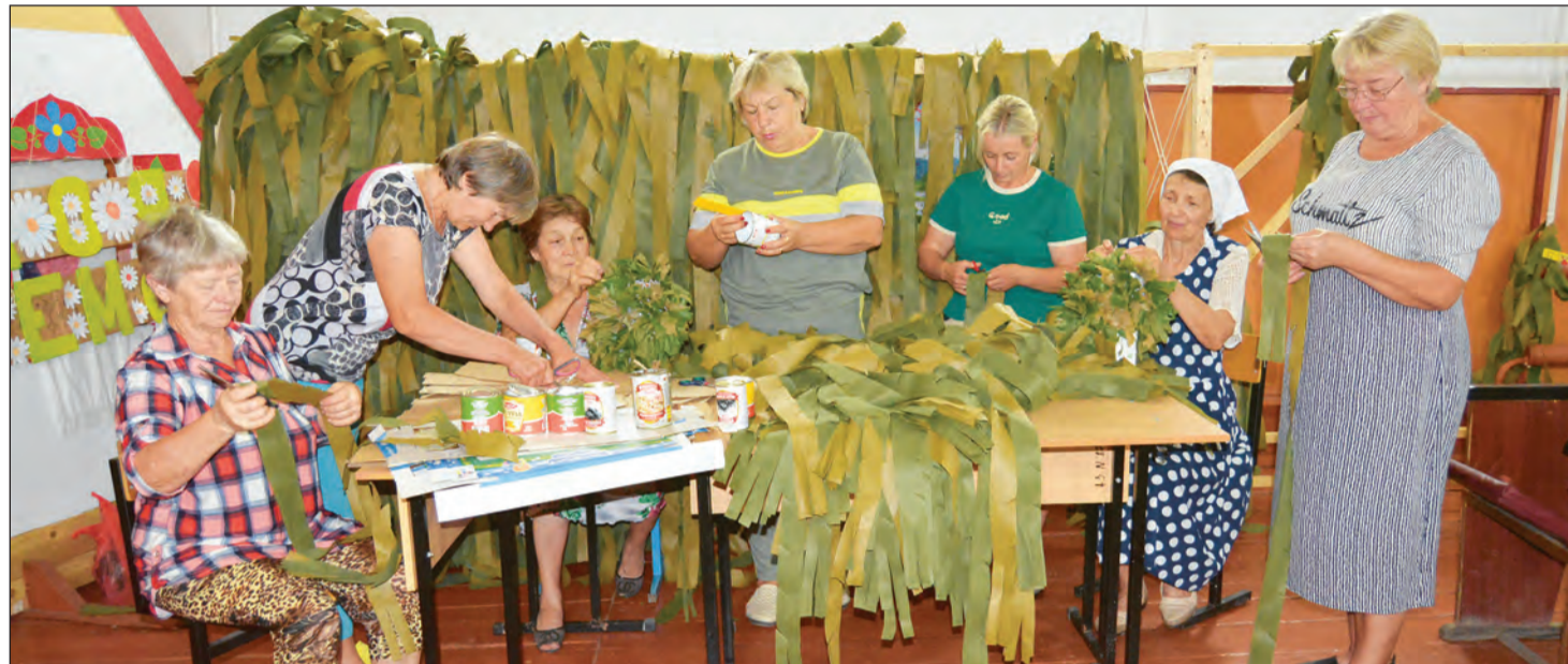
■ Полтавские активисты плетут маскировочные сети и нашьлемники для передачи в зону СВО

Районные волонтеры активно помогают нашим бойцам на фронте