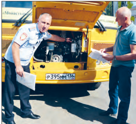
Проверка технического состояния автобусов