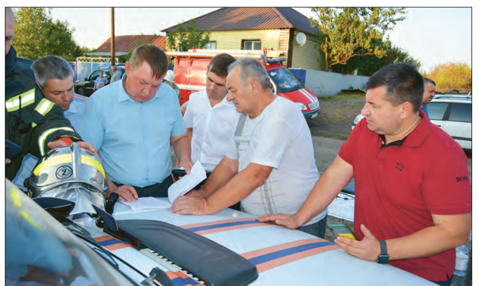
Представители районной и местной администраций обсуждают план локализации пожара