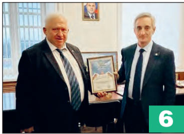
В Богучаре побывал президент Союза малых городов России