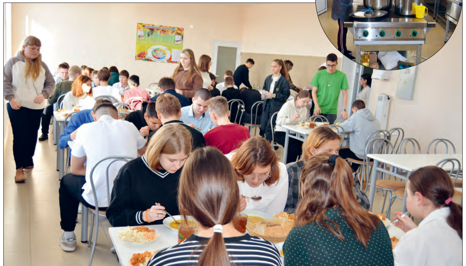
■ Во время обеденного перерыва в школьной столовой всегда многолюдно

В комфортабельной столовой школьников ежедневно ждут полноценные горячие обеды