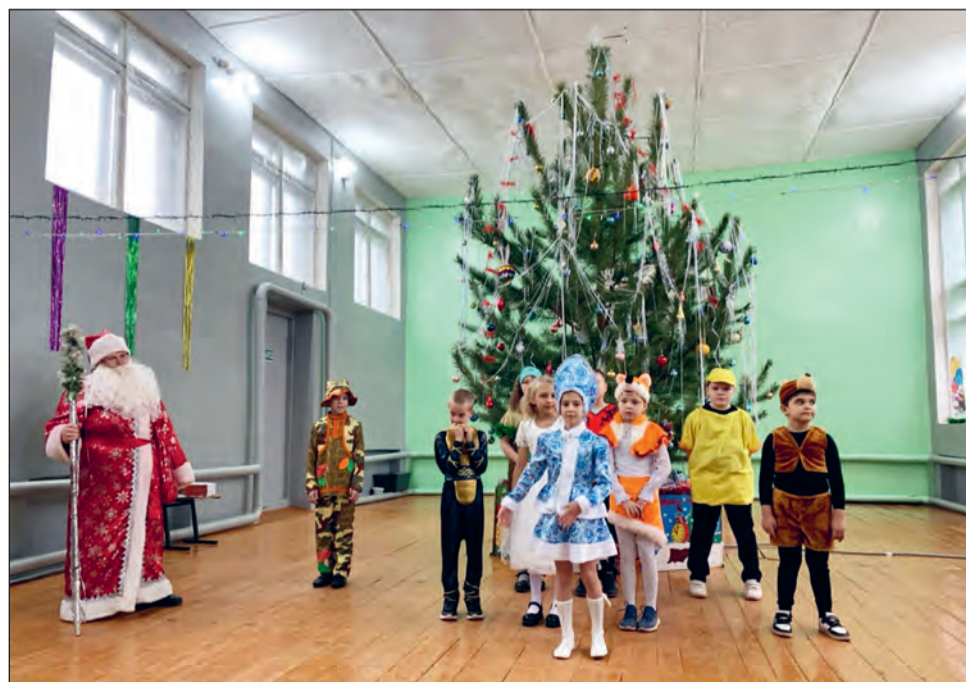
Светлый и просторный зал стал местом проведения новогоднего утренника