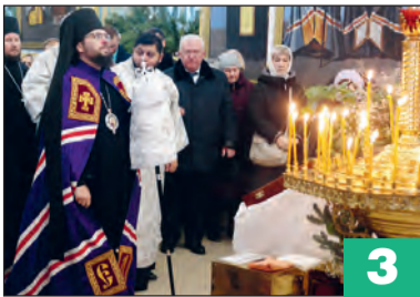
Глава Россошанской епархии епископ Дионисий совершил Божественную литургию в Богучарском храме