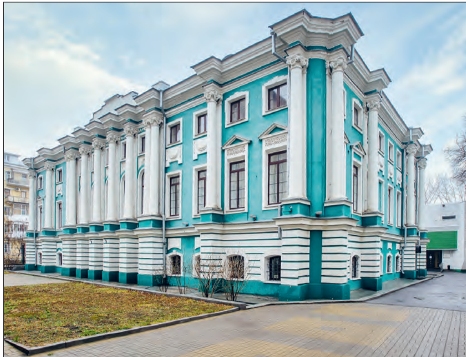
■ Здание Воронежского областного художественного музея им. И. Н. Крамского

Первый раз саркофаг пытались открыть в 1965 году. Тогда это не удалось, так как колышки основания были замазаны клеем и прочно прилипли. Вторая попытка приоткрыть саркофаг была сделана в 2015 году. Крышку приоткрыли и с помощью специальной камеры посмотрели, что скрывается внутри. Оказалось, что он покрыт потрясающей росписью, которая за 3 тыс. лет прекрасно сохранилась. Изо-