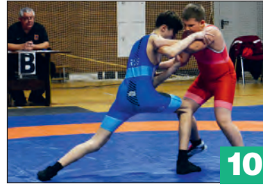
Первенство Воронежской области по греко-римской борьбе прошло на базе спорткомплекса «Юность»