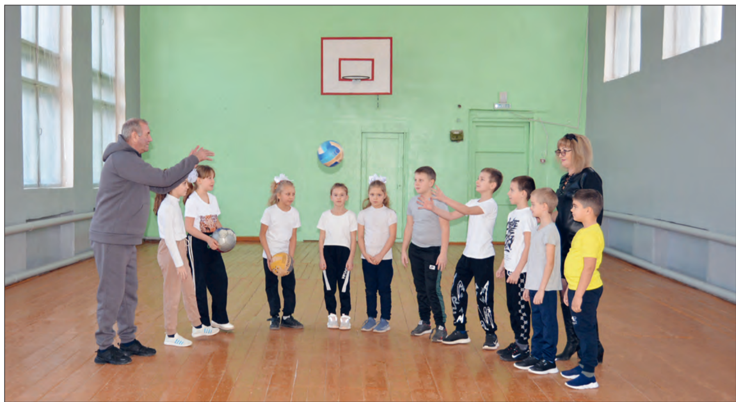
Уроки физкультуры для южанских школьников проходят в отремонтированном спортивном зале

Теперь заниматься спортом дети будут в обновленном помещении